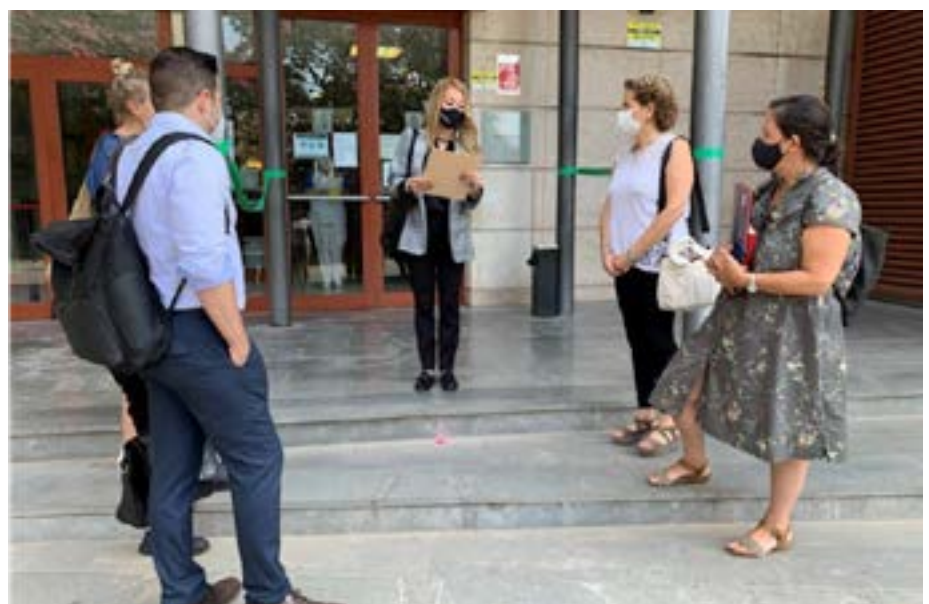
Reivindicació dels drets humans a l'Afganistan, davant dels Jutjats de la ciutat..