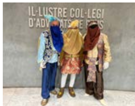
Visita dels patges reials a la seu col·legial.

reials a la seu col·legial, acte que organitzava l'ICAREus amb motiu de les festes nadalenques. No obstant això, els patges reials van venir a la seu col·legial a recollir les cartes i van preparar uns vídeos amb missatges personalitzats per als nens i nenes que ho van sol·licitar.