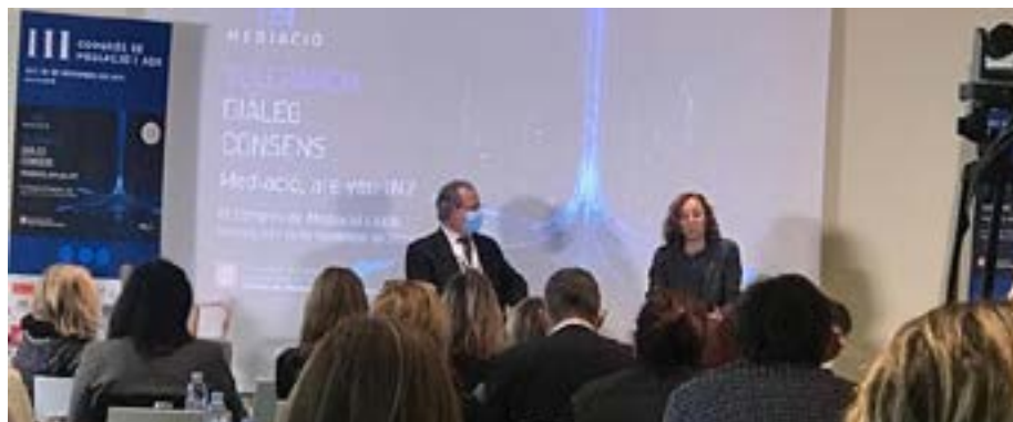
Durant la realització del III Congrés de Mediació i ADR, del novembre de 2021 a Mataró.

La Junta General Ordinària del desembre de 2021 va aprovar, per unanimitat, els pressupostos de l'ICAREus per l'any 2022. Es poden consultar aquí .