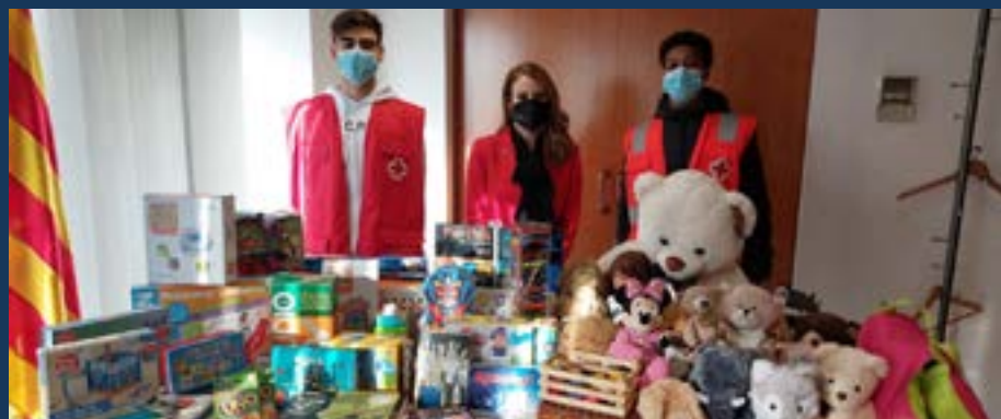
Recollida de joguines per part de Creu Roja.

Com cada any, i amb motiu de les festes nadalenes, la comissió de Drets Humans de l'ICAREus va organitzar una campanya de recollida de joguines i productes infantils d'higiene i d'aliments a favor de Càritas i Creu Roja de Reus, entitats amb les quals hi ha convenis de col·laboració. La campanya es va centrar en els infants. Creu Roja va recollir i distribuir les joguines i Càritas es va encarregar de recollir i distribuir productes d'higiene i aliments infantils.