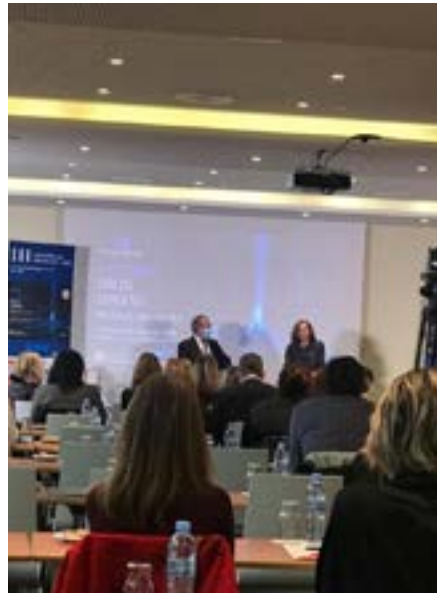
Realització del III Congrés de Mediació del CICAC

El CICAC va organitzar el III Congrés de Mediació i Resolució Adequada de Conflictes (ADR), dirigit a l'advocacia i a professionals vinculats a la mediació el mes de novembre del 2021. El congrés va tenir lloc a Mataró i es va desenvolupar sota el lema 'Tolerància, diàleg, consens. Mediació'.