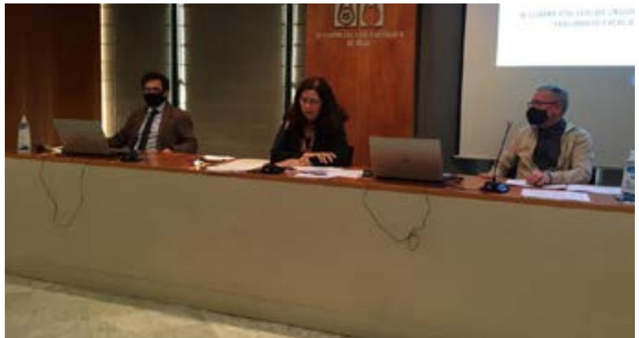
Un instant a la celebració de la Junta General Ordinària.

La primera Junta General Ordinària de l'any 2021 es va celebrar per part de la junta el 26 de març de 2021. En aquesta sessió, es va presentar la MEMÒRIA DEL DEGANAT de totes les activitats col·legials que s'han dut a terme durant l'any 2020 i es va aprovar per unanimitat la liquidació dels comptes de l'any 2020. Consulteu aquí la liquidació de l'any 2020.