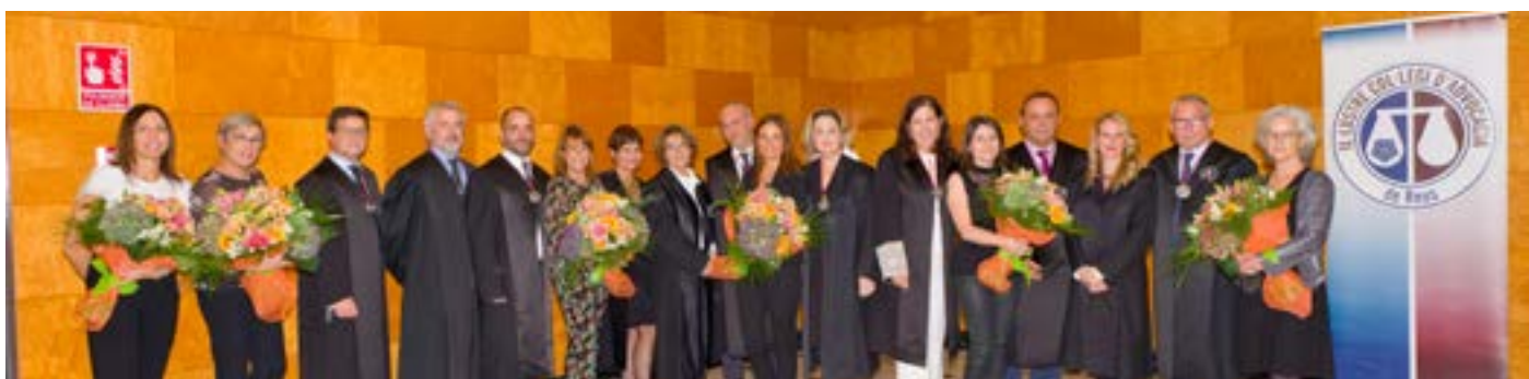
La Junta de Govern de l'ICAREus va donar uns rams de flors a l'equip d'administratives i gerència