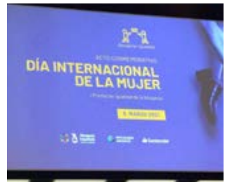
L'acte commemoratiu del CGAE pel Dia Internacional de la Dona, dut a terme a Madrid.