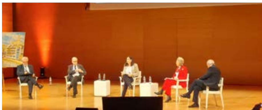
Durant la celebració del V Congrés de l'Advocacia Catalana a Girona.

La comissió del Fons d'Obra Social va dur a terme la segona reunió anual el 18 de novembre de 2021. A tall de recordatori, el Fons d'Obra Social es va crear per a concedir ajudes a aquells col·legiats o col·legiades o als seus