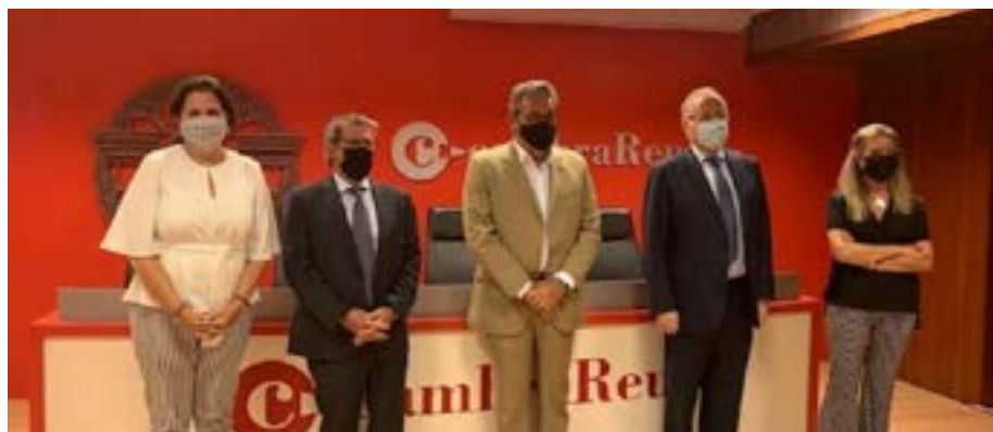
Durant la signatura del conveni amb la Cambra de Comerç de Reus i el Consolat de Mar.