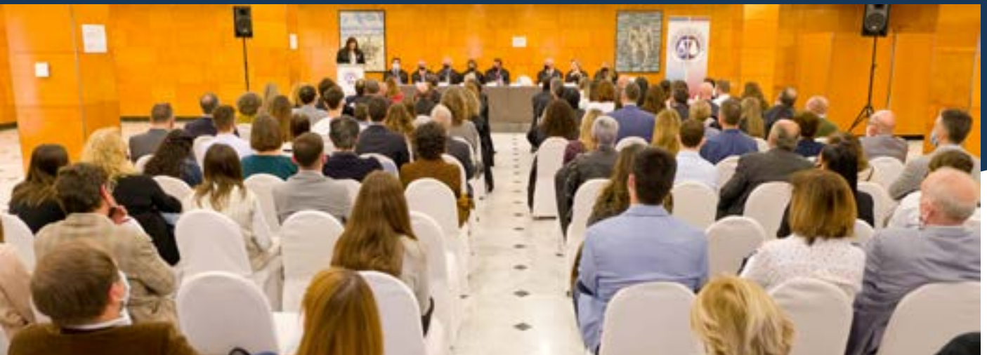
Un instant de l'acte col·legial