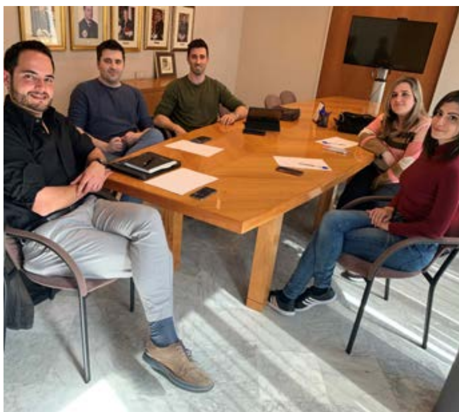
la nova junta del Grup d'Advocacia Jove de Reus.