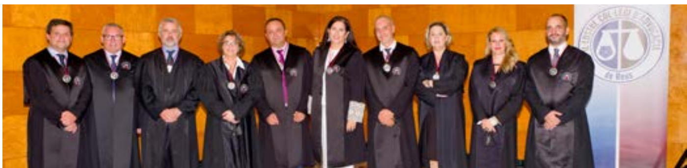
La Junta de Govern de l'ICAREus