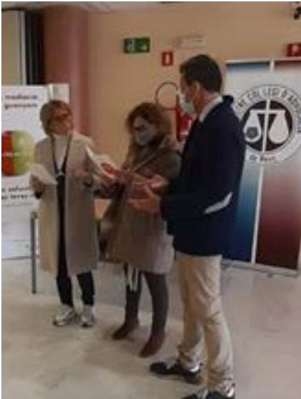
Punt informatiu instal·lat als Jutjats de Reus.

El Dia Europeu de la Mediació d'enguany ha portat a membres de la comissió de Mediació de l'ICAReus a instal·lar al vestíbul de la seu judicial un punt d'informació sobre la mediació.