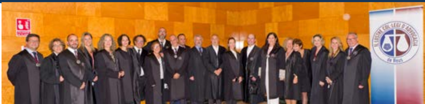
La Junta de Govern de l'ICAREus i els advocats i advocades distingits per haver fet 25 anys de professió