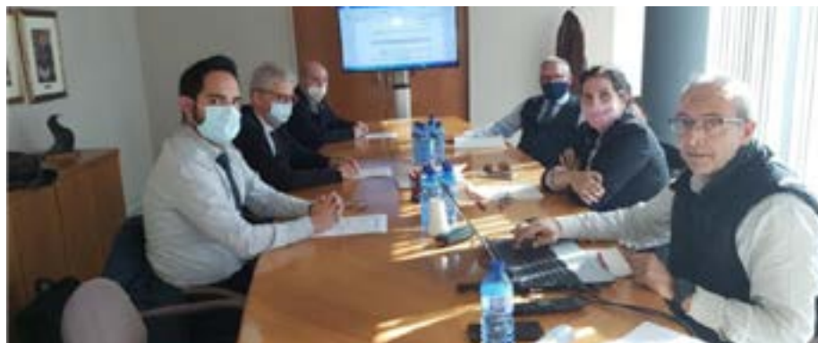
Reunió de la comissió del Fons d'Obra Social, al Col·legi de l'Advocacia de Reus.

El CICAC va organitzar els dies 25 i 26 de novembre de l'any passat el III Congrés de Mediació i ADR, on membres de l'ICAREus van ser-hi presents.