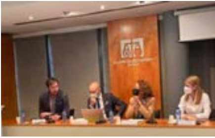
Acte de presentació del CEMICAR.