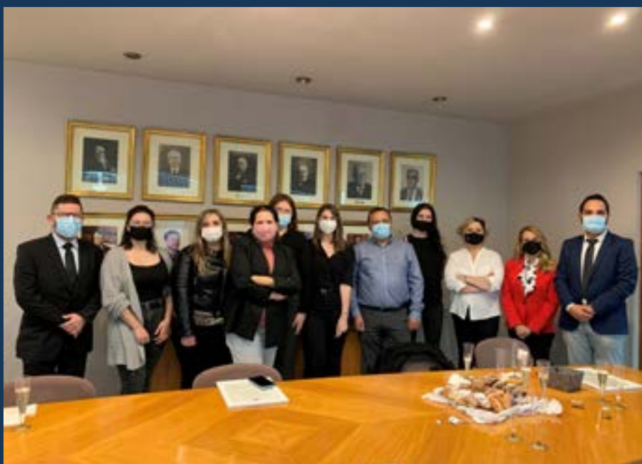
Foto de grup de la recepció dels llavors futurs nous togats i noves togades al Col·legi.