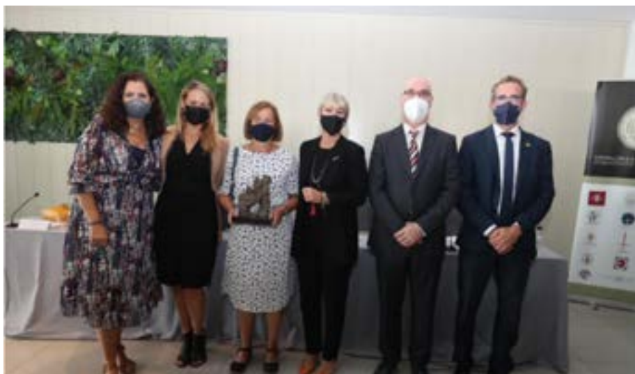
Celebració de l'acte del Premi Agustí Juandó i Royo.