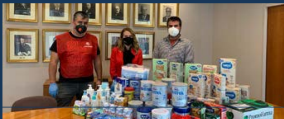
Lliurament de productes infantils d'higiene i aliments a Càritas, en el marc de la campanya solidària.