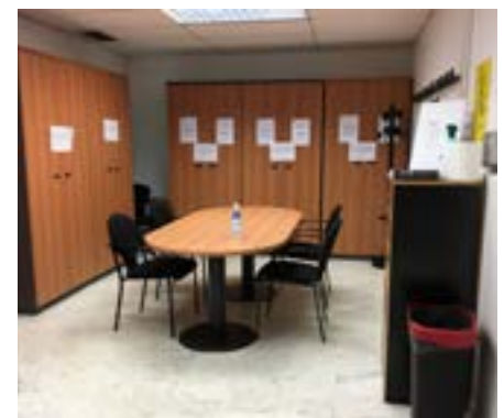
Diferents dependències en què s'hi han dut a terme arranjaments.