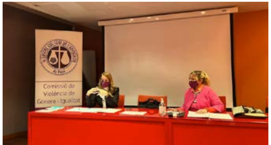
Dues xerrades de diversa temàtica organitzades per la comissió d'Igualtat i VIGE.

El Casal de Dones de l'Ajuntament de Reus, juntament amb la comissió d'Igualtat i Violència de Gènere de l'ICAREus, van iniciar el programa 'Sheimpulsa', dut a terme en línia, adreçat a dones de la ciutat d'entre 25 i 55 anys. La iniciativa va apostar per la capaciació i l'acompanyament enfocat en l'empoderament i projecció professional.