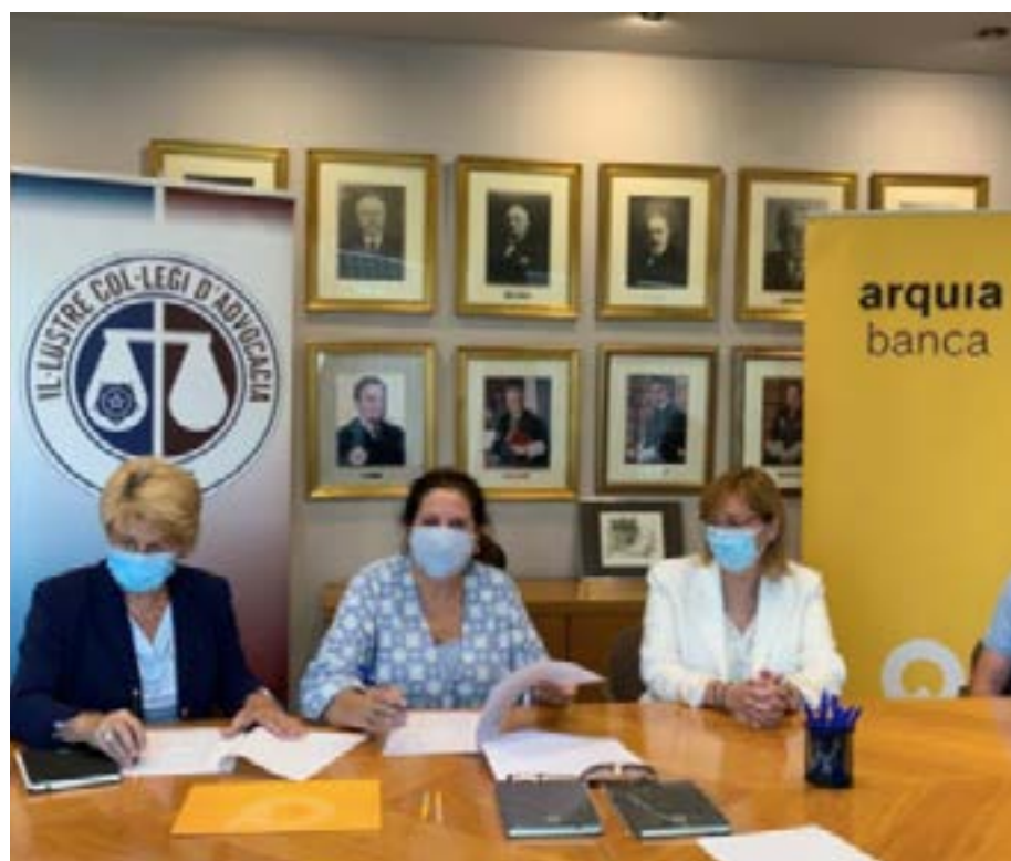
Signatura del conveni d'Àrquia Bank