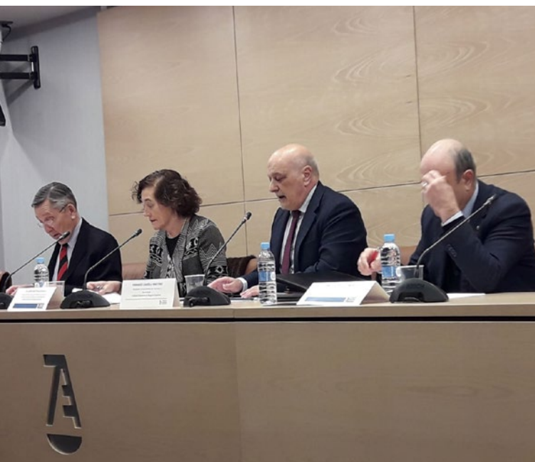
Visita a les Jornades de Deontologia organitzada pel Consejo General de la Abogacía Española