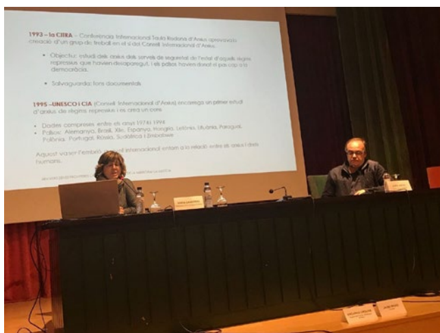
Imatge de la conferència al Centre de Lectura de Reus amb Arxivers sense Fronteres