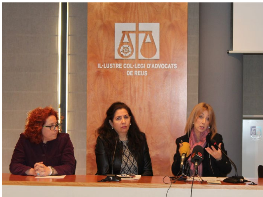
Durant la roda de premsa de presentació del Servei d'Atenció Jurídic Animalista (SOJA)

litat el telèfon del mateix Col·legi (977 34 08 50) i el correu electrònic de la comissió, impulsora de la iniciativa (cpda@advocats reus.org).