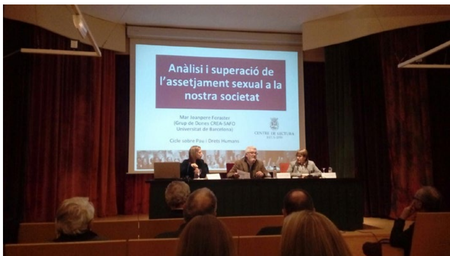
Conferència sobre l'assetjament sexual a la societat, en la qual va col·laborar la comissió dels Drets Humans amb el Centre de Lectura de Reus

El Col·legi d'Advocats de Reus du a terme diverses activitats al llarg de la setmana. Es tracta d'un gruix informatiu que s'aplega en resums setmanals al web del Col·legi. En aquest apartat, us mostren un recull fotogràfic de les activitats que s'han dut a terme des del mes de gener.