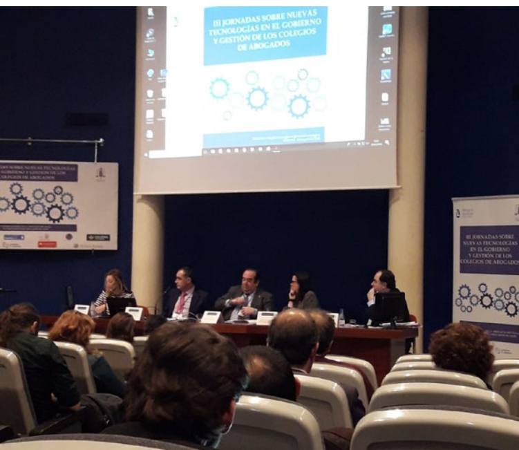
Assistència a les Jornades Tecnològiques celebrades a Gijón