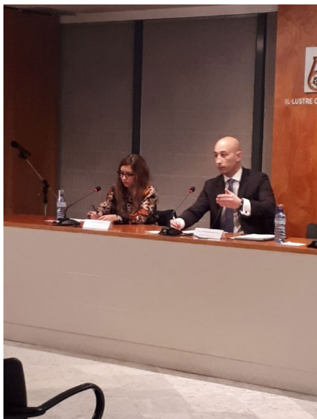
Xerrada del GAJREUS sobre els aspectes processals de l'acomiadament