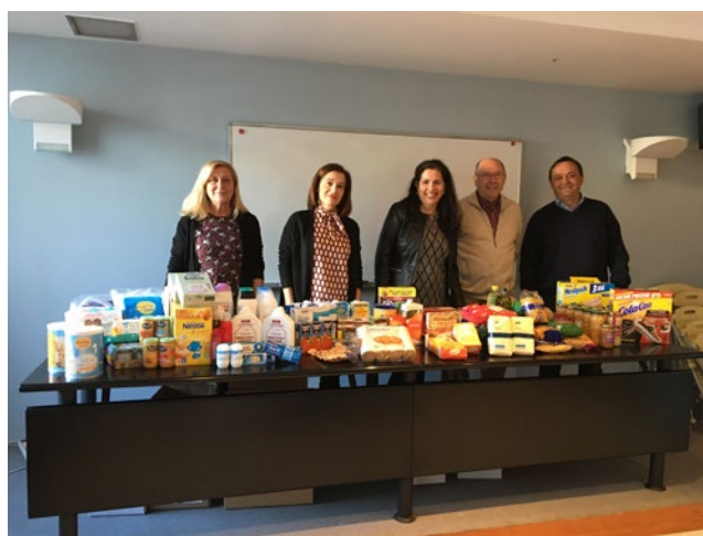
Campanya de recapte de Nadal de Càritas