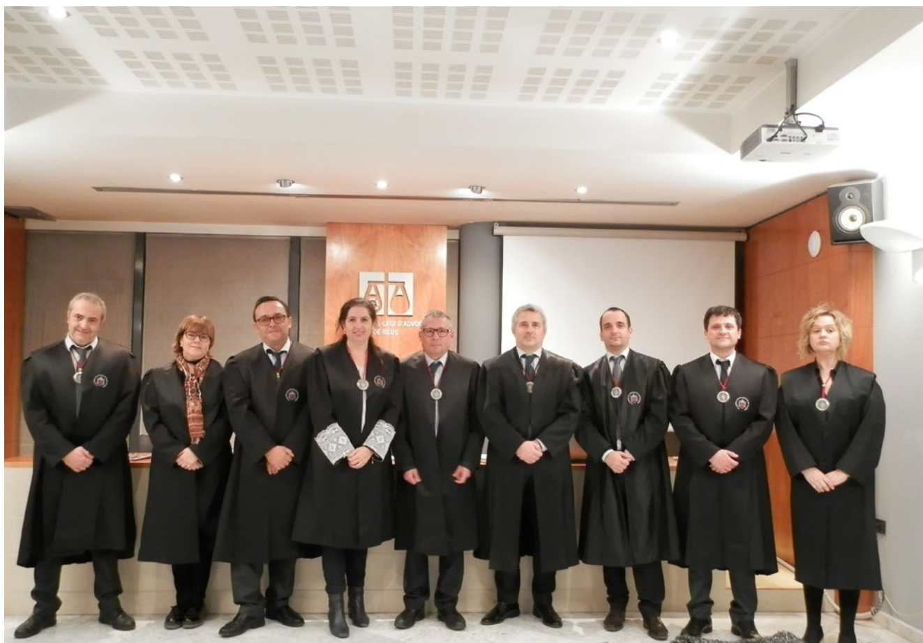
Imatge dels nous membres de la Junta de Govern del Col·legi d'Advocats de Reus en el dia de la presa de possessió

En data 30 de gener de 2018 i durant la celebració de la primera Junta General Ordinària de l'any es van posar de manifest tots aquells fets, esdeveniments i treballs que s'havien dut a terme des del Col·legi d'Advocats durant l'any 2017.