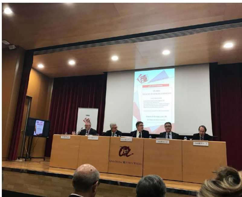
Acte del 25è aniversari de la Facultat de Jurídiques de la URV