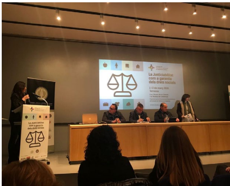
Assistència al III Congrés dels Drets Humans del Consell de l'Advocacia Catalana