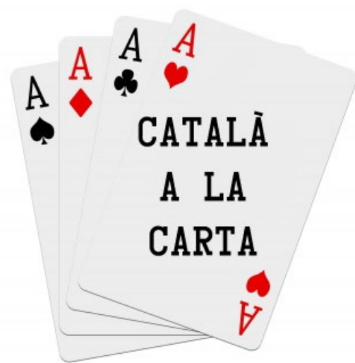
Iniciativa del CICAC amb la qual es fa esment de novetat lingüístiques d'àmbit jurídic.