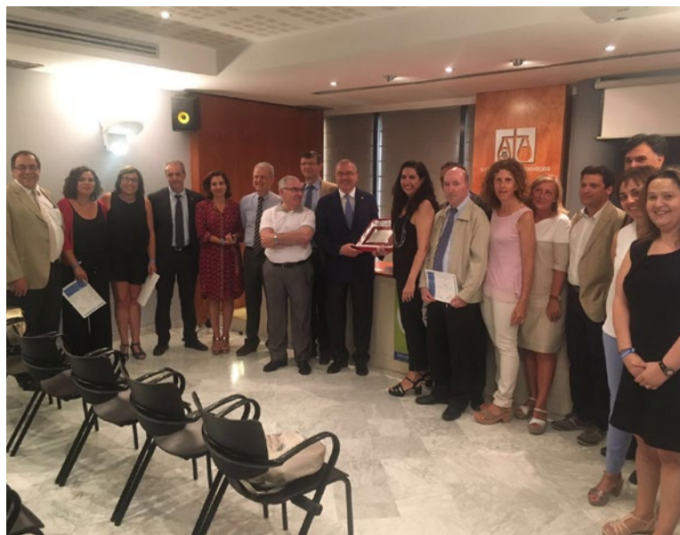
Acte de celebració del Dia de la Justícia Gratuïta i del Torn d'Ofici.