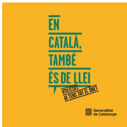
Campanya amb la qual l'ICAR va col·laborar.

Per tot plegat, publiquem regularment les novetats de la iniciativa del CICAC del Català a la Carta al web de l'ICAR, com també tenim diversos accessos directes a diversos espais lingüístics com ara les pàgines de 'Terminologia Jurídica' o a la pàgina de la Generalitat de Catalunya en l'apartat de la campanya 'En català, també és de llei'.