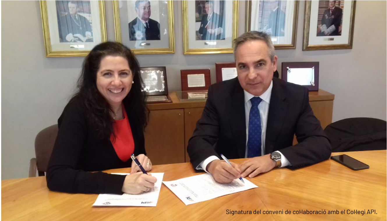
Signatura del conveni de col·laboració amb el Col·legi API.

En el cas de les campanyes, l'Il·lustre Col·legi d'Advocats de Reus i el Consell dels Il·lustres Col·legis d'Advocats de Catalunya van presentar durant el 2016 una campanya en la qual defensaven i conscienciaven a la ciutadania que s'hauria de tenir un advocat 'de capçalera'. Sota el lema 'No t'arrisquis: val més prevenir que litigar', l'objectiu principal és fer entendre a tothom que s'ha de tenir cura del coneixement que tot ciutadà ha de tenir pel que fa a qüestions jurídiques i d'assessorament i buscar l'advocat de proximitat.