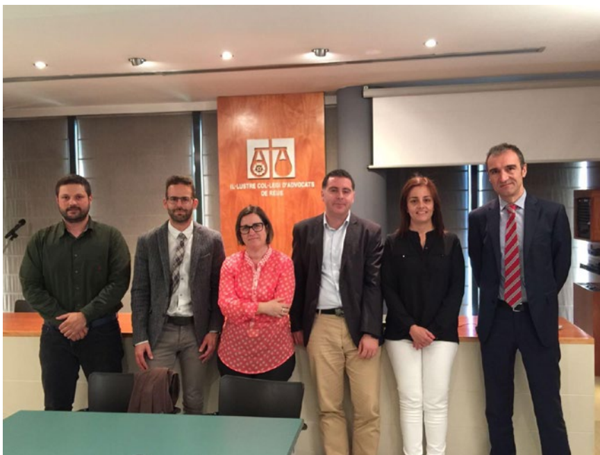
Foto de grup de la comissió de Taxació de costes i jura de comptes.