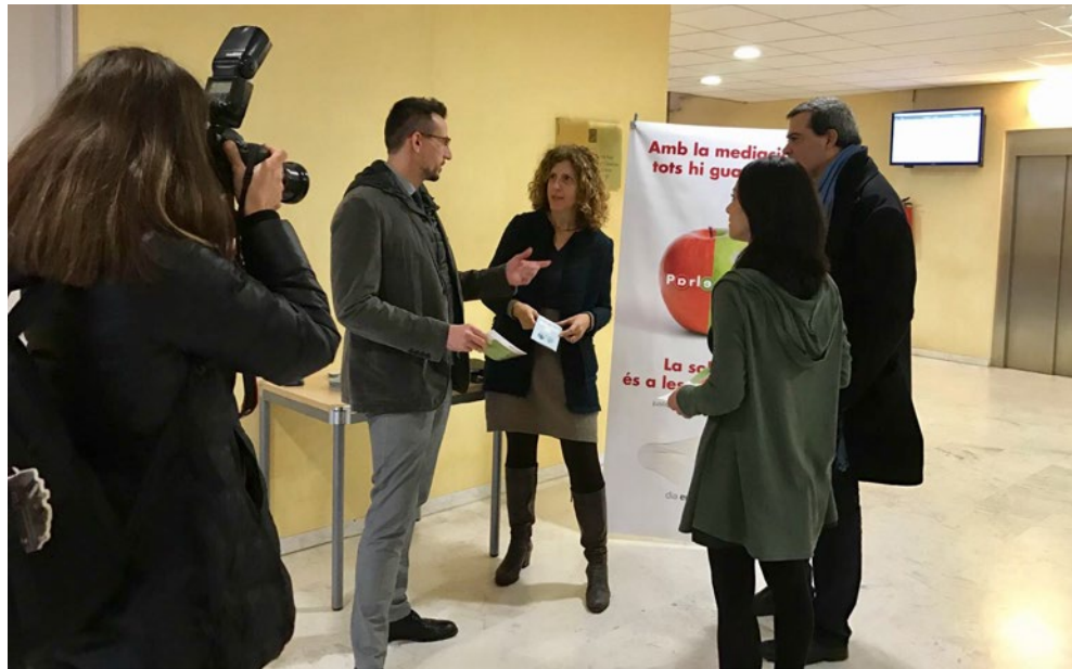
Taula informativa sobre la mediació als Jutjats de Reus.

estat al gener de 2017 amb una taula informativa amb motiu de la celebració del Dia Europeu de la Mediació als Jutjats de Reus, on advocats formats en mediació van assessorar a peu de carrer els ciutadans sobre les vies possibles per tal d'evitar una discussió.