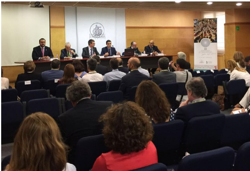
Assistència a la inauguració de les XI Jornades Nacionals de les CRAJ a Mataró (2016).

31 de març d'aquest 2017, la comissió de l'ICAR va fer acte de presència a la cita que es va organitzar a Oviedo.