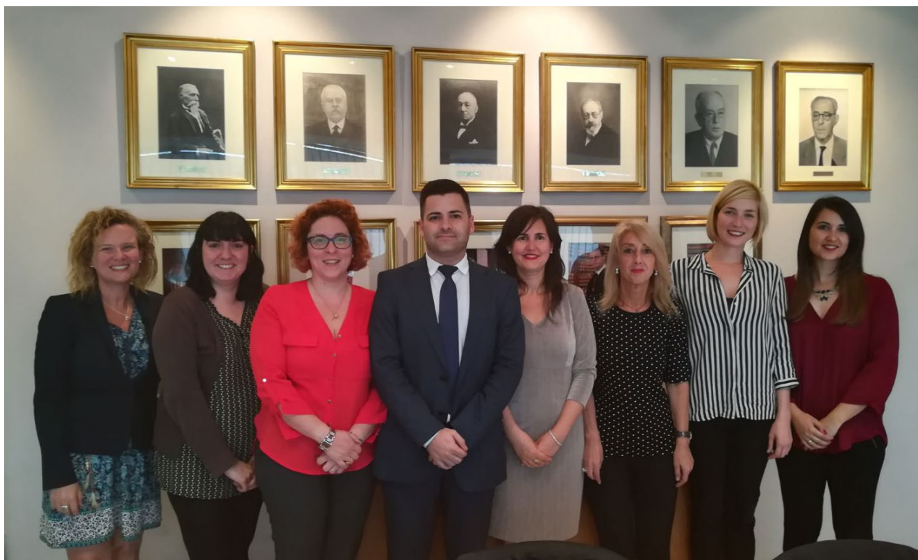
Foto de grup de la Comissió per la defensa dels drets dels animals.

Els objectius inicials de la Comissió són els següents: Elaboració de Protocols i/o Recomanacions dirigides als Cossos de Seguretat del Partit Judicial, per tal d'actuar